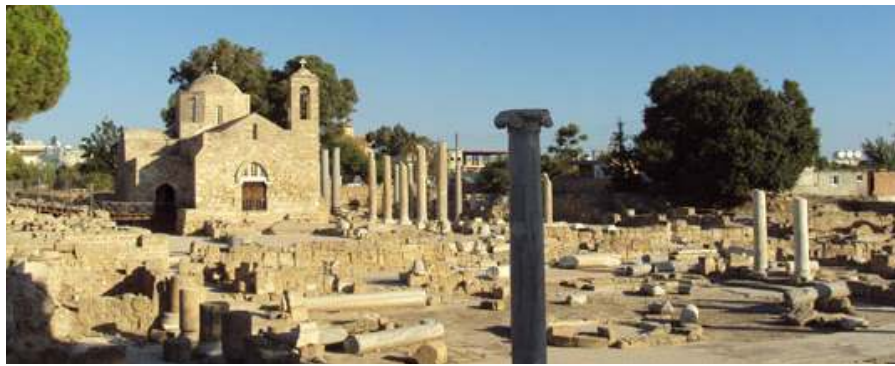
Δυστυχώς, κάποιοι δημιουργούν θέμα με την Καθολική Εκκλησία...