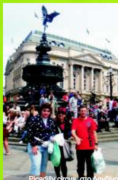
Picadilly circus στο Λονδίνο