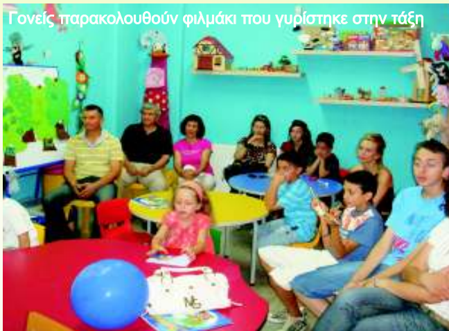
Γονείς παρακολουθούν φιλμάκι που γυρίστηκε στην τάξη