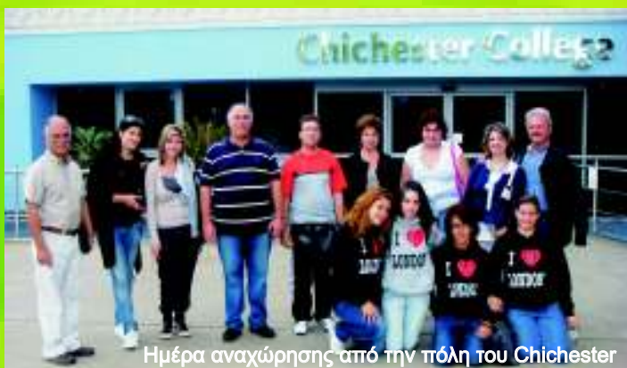
Ημέρα αναχώρησης από την πόλη του Chichester