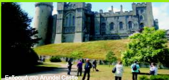
Εκδρομή στο Arundel Castle